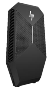
HP Z VR G2 Backpack Workstation