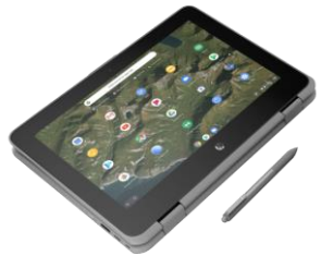
HP Chromebook x360 11 G2 Education Edition