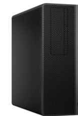
HP EliteDesk 800 Workstation Edition (VR bateragarria)