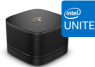
HP Elite Slice G2 + Unite