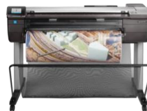
HP DesignJet T830 36"