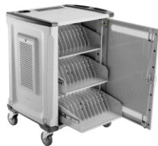
HP Charging Cart