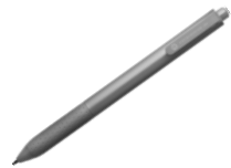
Chromebook EMR Active Pen