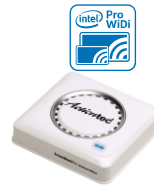
Widi Actiontec Business Edition