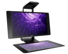
Sprout Pro G2 by HP