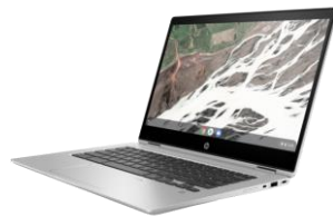
HP Chromebook x360 14 G1